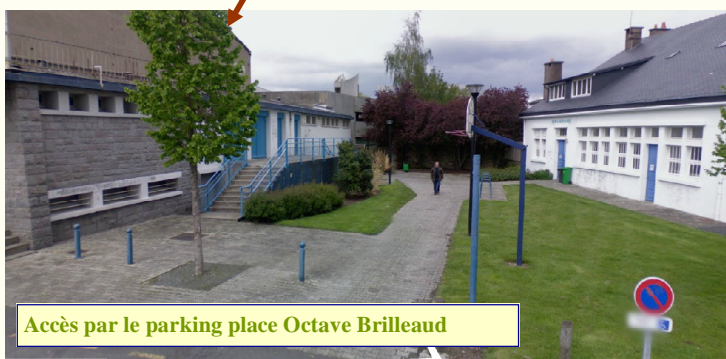
Accès par le parking place Octave Brilleaud