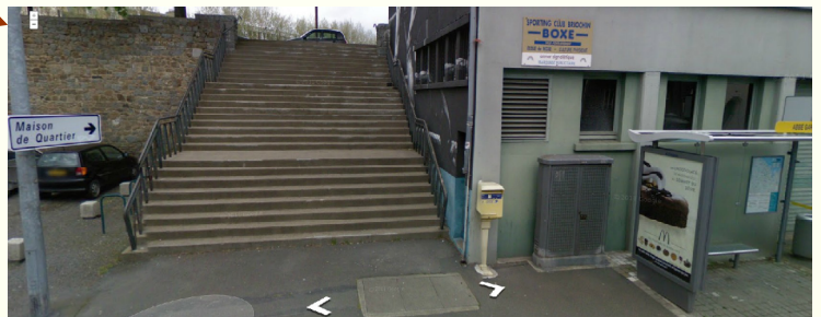
Accès escalier au 16 rue Abbé Garnier (Les lignes de bus du Tub ne desservent pas ce quartier le dimanche)