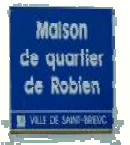
Maison de Quartier de Robien Place Octave Brilleaud Saint-Brieuc ( 22 )